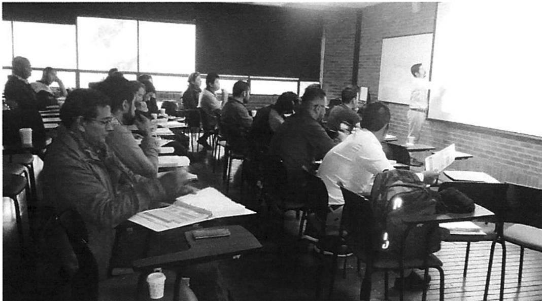
Imagen #2: Exposición teórica