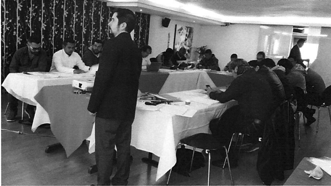
Imagen #1: Sesión de equipo de trabajo