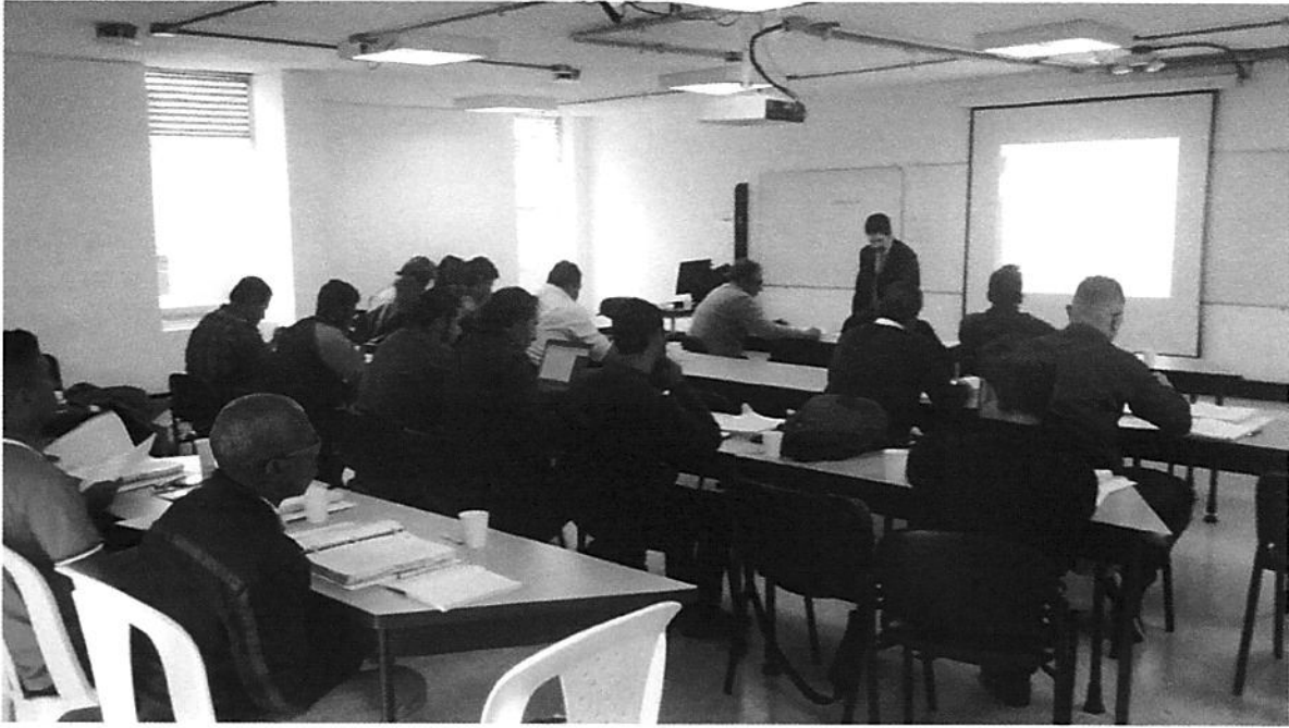
Imagen #3: Exposición teórica